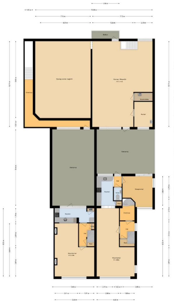
Eerste verdieping Dennewaai 54a + 56 Zwanenburg